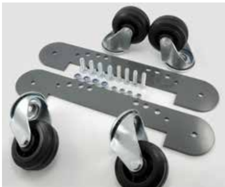
Radsatz zur Montage unter dem Schutzbügel (Artikel-Nr. 78861413)