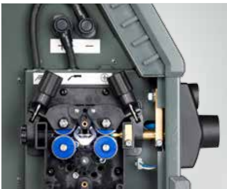
LED-Licht in der Drahtkonsole (Artikel-Nr. 78861545)