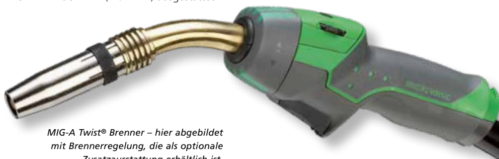
MIG-A Twist® Brenner – hier abgebildet mit Brennerregelung, die als optionale Zusatzausstattung erhältlich ist.

MIG-A Twist® ist in verschiedenen Längen und unterschiedlichen Schwanenhälsen erhältlich. Zur Wahl stehen verschiedene Bedieneinheiten für den Brennerhandgriff, von wo aus die Schweißstromstärke zu steuern ist. Die Bedieneinheit ist auf Wunsch einfach auszutauschen – ohne die Verwendung von Werkzeug.